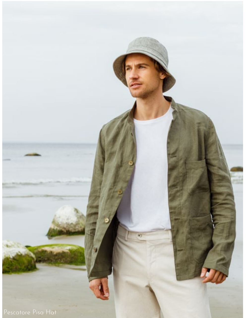
Pescatore Pisa Hat