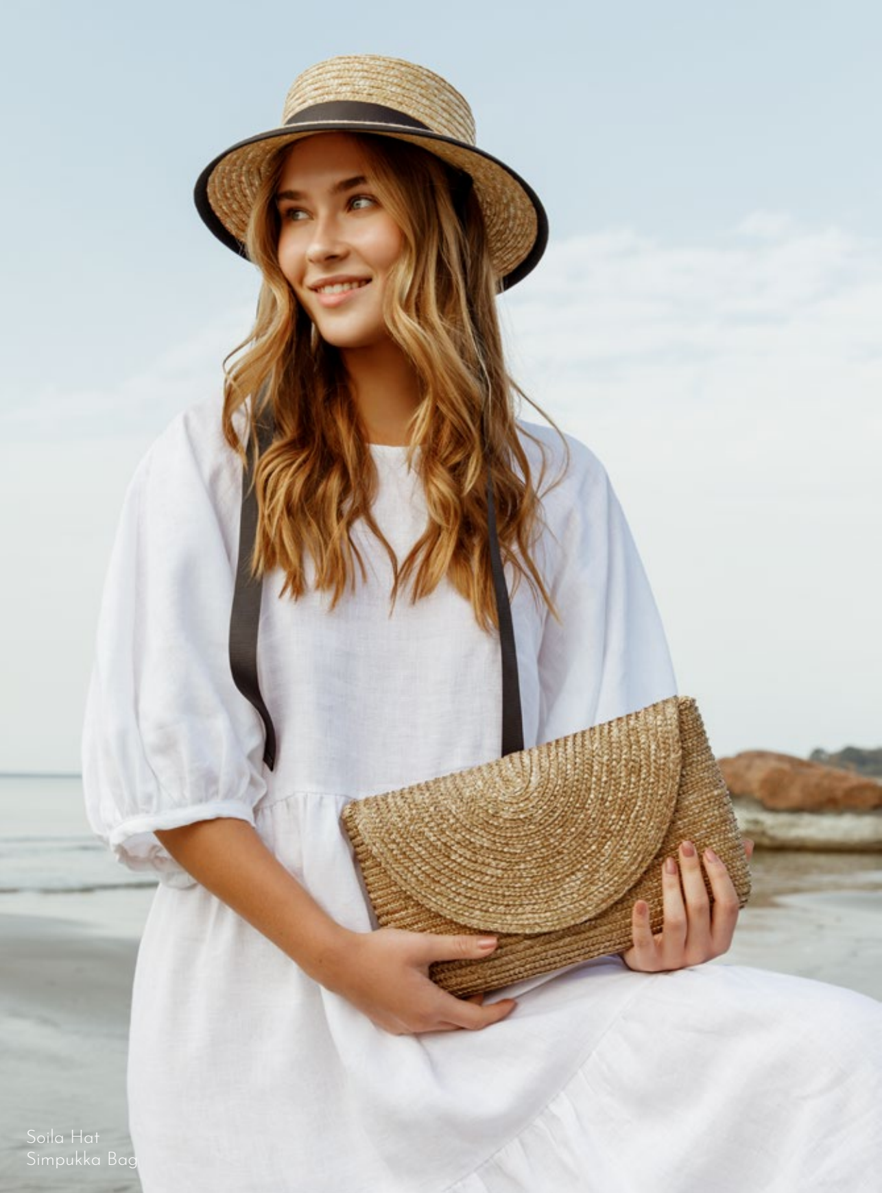
Soila Hat Simpukka Bag