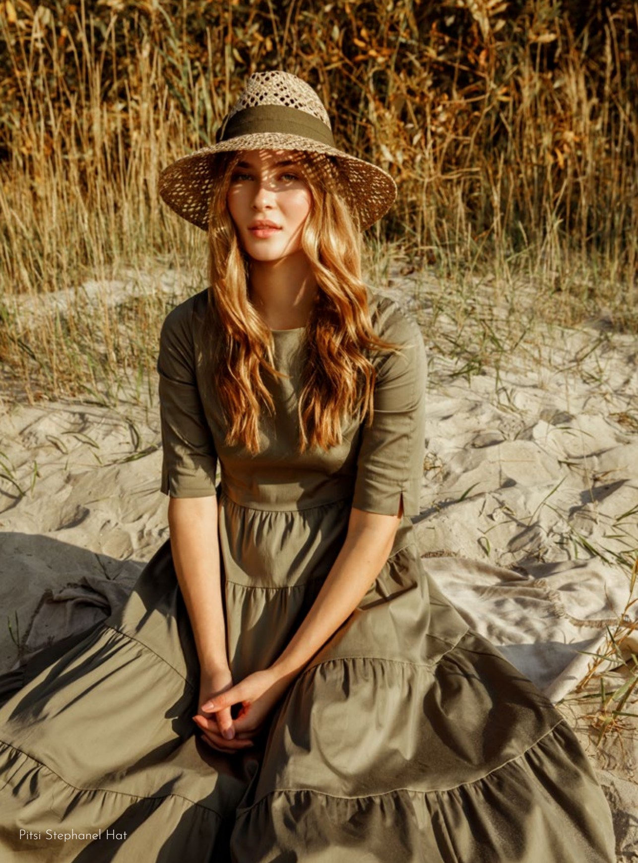
Pitsi Stephanel Hat