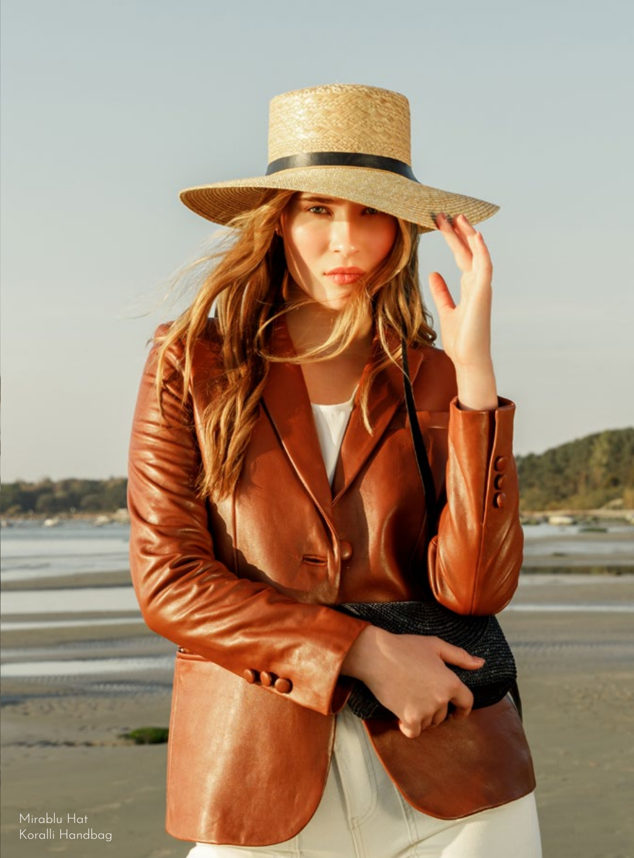
Mirablu Hat Koralli Handbag